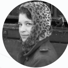
Solenne Capmas Costumes