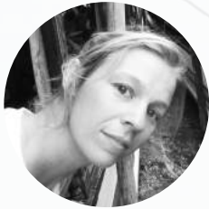
Camille Foucher Diffusion - production