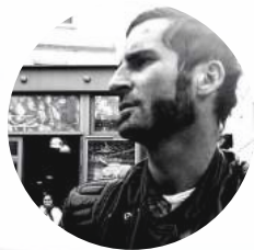
Djeyla Roz Musique