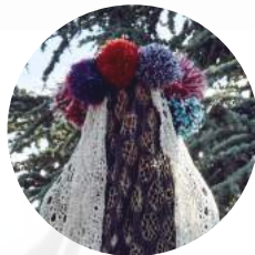
Anaïs Longieras Coordination médiation